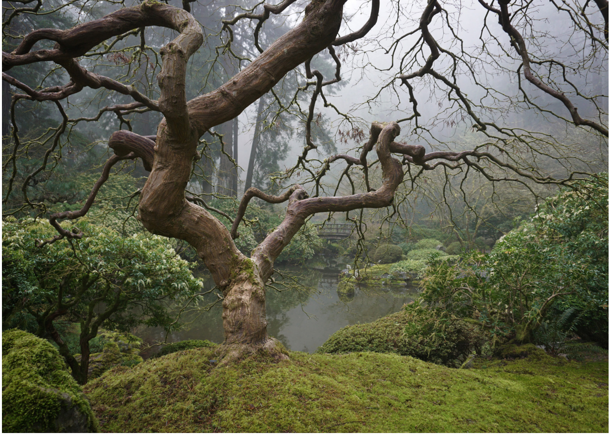
"The Tree," Portland Japanese Garden's beloved and highly photographed maple, in winter.