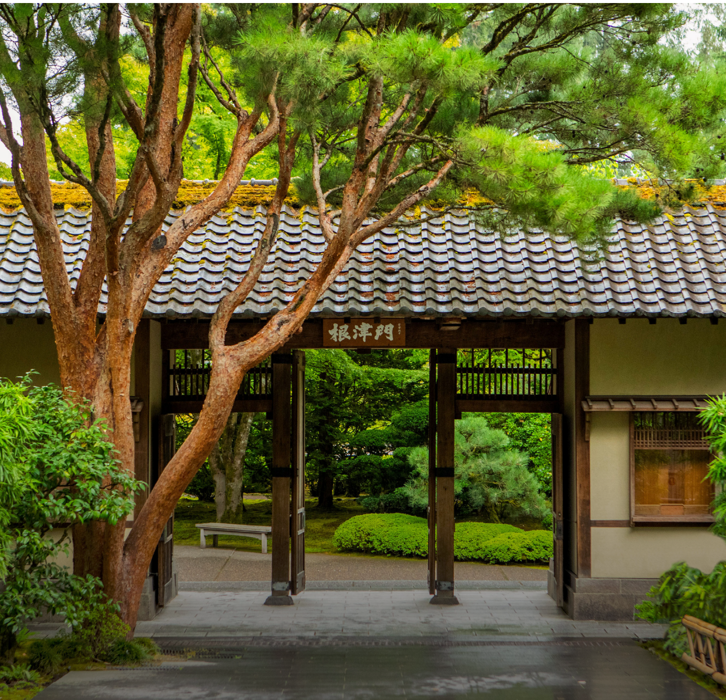
Nezu Gate at Portland Japanese Garden, dedicated in honor of Koichi and Mihoko Nezu on April 24, 2023